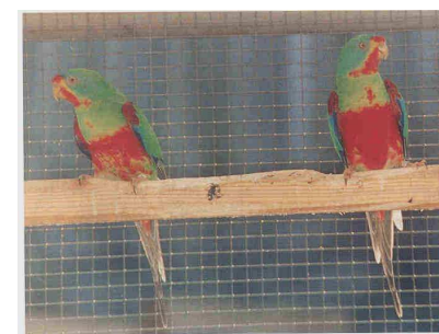
Figuur 14: De faded, misty en roodbuik kleurmutaties van de swiftparkiet