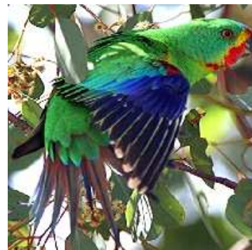
Figuur 3: Mooie Felgekleurde overjarige swiften

Hoewel op het eerste gezicht lastig, is bij een nadere inspectie van de vogels, het geslacht van deze vogels redelijk te bepalen. De mannen zijn wat intensiever van kleur. Het rood rond de snavel is feller en de man heeft meer blauw op de kop. De rode stuitveren van de pop zijn veel minder rood dan die bij de mannen. Verder is de iris bij de man meer oranjegeel en is die van de pop bruingeel. De jongen zijn veel matter van kleur dan hun ouders en hebben ook nog geen gekleurde irisring. Ook is het mogelijk, afhankelijk van de roodintensiteit van de poppen, om het onderscheid waar te nemen in een tweetal rugdekveren. Bij de jonge poppen zijn deze soms geel/rood en bij de mannen zijn ze volledig rood. Goede poppen hebben als ze volwassen zijn ook rode rugdekveren. De onderste stuitveren zijn bij de man intensief rood en bij de pop veel minder intensief rood. De jongen ruien op een leeftijd van 5 maanden en zijn op een leeftijd van 9 maanden volledig op kleur. Ook komt na het ruien de irisring van de man op kleur (oranje). Naar gelang de vogels ouder worden, worden ze steeds mooier van kleur.