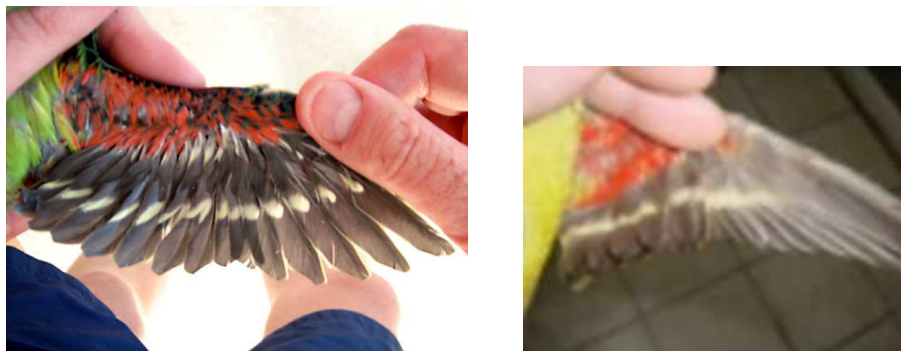
Figuur 5: (Links) - De ondervleugel van een jonge pop vertoont bredere witte stippen dan die van een jonge man, (Rechts) - Bij een overjarige pop zijn de witte brede witte stippen op de ondervleugel meestal aan elkaar gegroeid tot een vage witte band.

paren onderling. Hun kweekgebieden liggen in Tasmanië en de omliggende eilanden in de Bass Straat. Tussen januari en mei verlaten ze dit gebied voor enkele maanden en overwinteren buiten het kweekseizoen in Zuid Oost Australië, hoofdzakelijk in het midden en zuiden van Victoria.