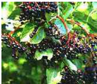
Veel schermen, een rijke oogst

'Een vlier hoeft je niet te zien bloeien, die ruik je gewoon!' De zware, friszoetige geur is vooral op warme dagen goed te ruiken. Zijn de bloemen helemaal open, dan is het tijd om ze te oogsten. Van de (gedroogde) bloemen kan een bloesemthee worden gezet of er kan onder andere vlierbloesemmelk of vlierbloesemsiroop van worden gemaakt.