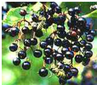
Rijpe bessen zijn diep paarsblauw

Worden de bloemen aan de struik gelaten, dan komen er in september - oktober diep blauwpaarse bessen te voorschijn. Wie wel eens zo'n besje uit het scherm heeft geplukt en geproefd, griezelt waarschijnlijk voor de rest van z'n leven en zal niet gauw nog eens zo'n bes willen proeven. De bitterzoete smaak van de bes kan dus niet iedereen bekoren. Maar vergist u zich niet. Wanneer de bessen op de juiste wijze worden bereid, kunnen er verrassende dingen ontstaan. Pluk de bessen pas als ze helemaal rijp zijn. Ze zijn dan zacht en hebben de neiging van het scherm af te vallen. Onrijpe bessen zijn licht giftig en kunnen (bij kinderen) diarree veroorzaken.